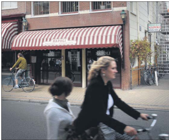
Pizzeria Napoli in de Astraat in Groningen.